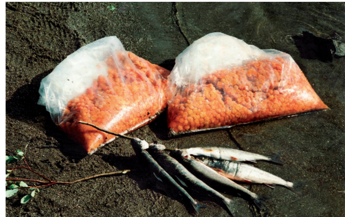
Lattaga ja guole Rávdan.

Dálla le vádtset gáttev birra luoktamáhkev. Ij le dat bálges gæhppat vádtset. Nav smilltjá. Smilltjá le gå gierge ja ij le beri duolmastit akta beri gák. Ja rádo. Galla tjuoladum ráddá, valla sierkka má sjaddá vas nav ruvva. De mij jávsádip Vájsáluoktaj gánná vádtsijda gávnnu dáhpe gánná máhtá idjadit. Mákset le vehik ruhta dasi gut dajna dábjin adná dahkamuháv.