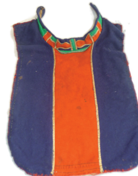
▲ Dát la nissunij sliehppá. Moadda sliehpá li goarodum hullolájgijn birra rabda, ja dan sisbielen ájn vil sávve.