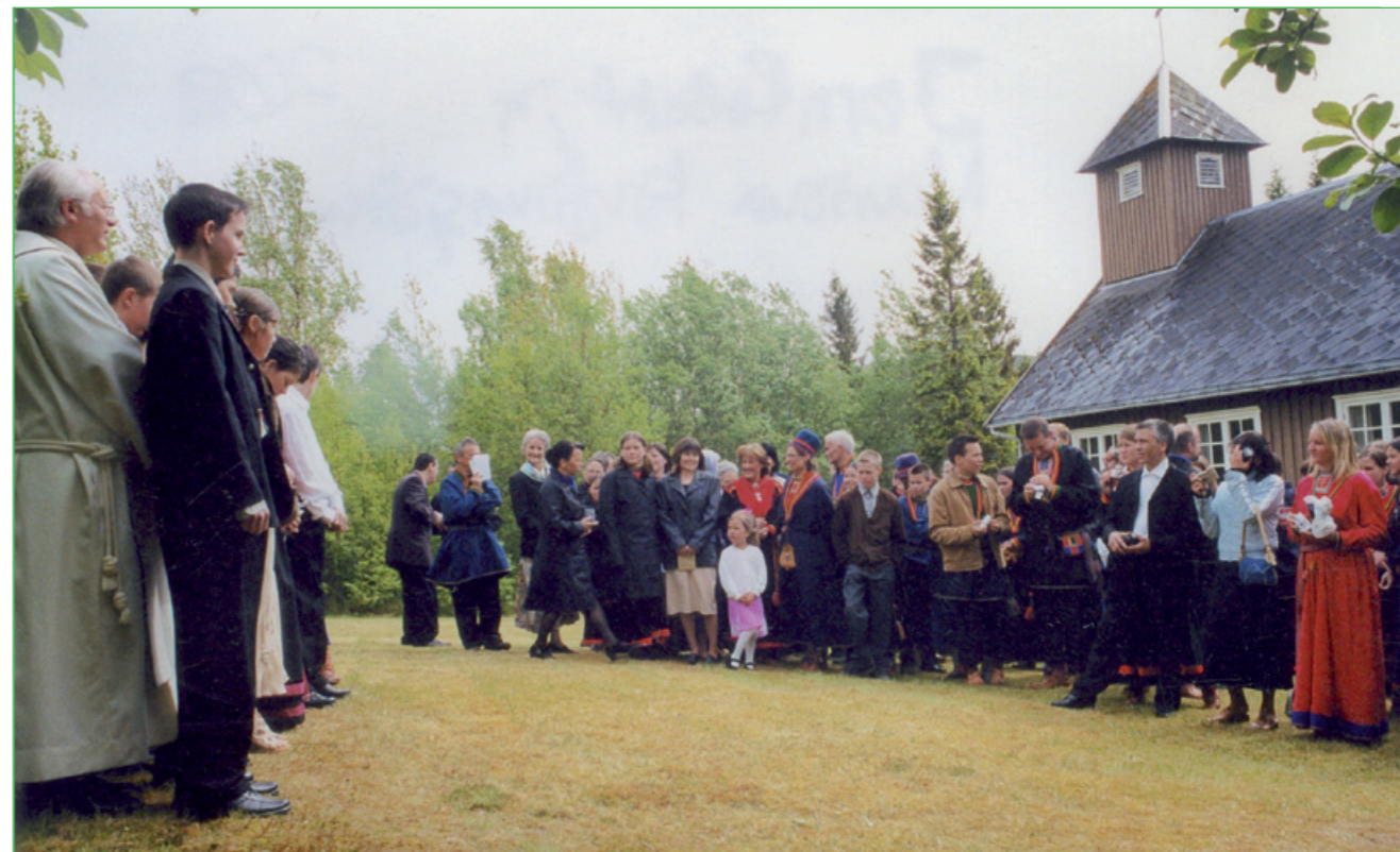
Jagen 2003 lij konfirmasjávnná ávdđá girkkon Ájlatten.