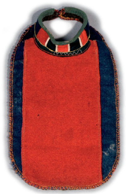
▲ Nissunij sliehppá julevsáme guovlos Svierigin. Ihkap la læhkám binná ruoppsis ruvdas, ja danen goarodum sijdo ietjá tyddjas?