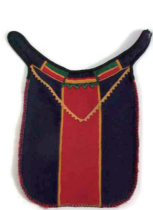
▲ Dá sliehpá li Stájgos. Gárobielen nissunij ja rievtesbielen álmáj. Norsk folkemuseum.