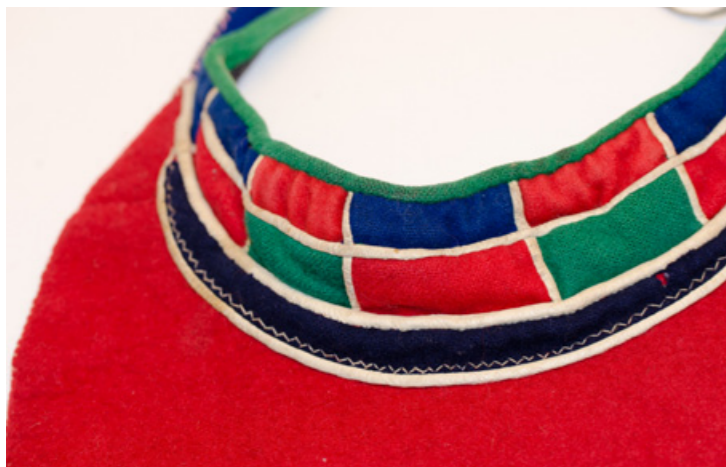
▲ Nissunij njallomsليهppá binná danijn, ja ruvdda badjegietjen mij lij dábálasj ávddála. Gávvidum Nordiska Musean.