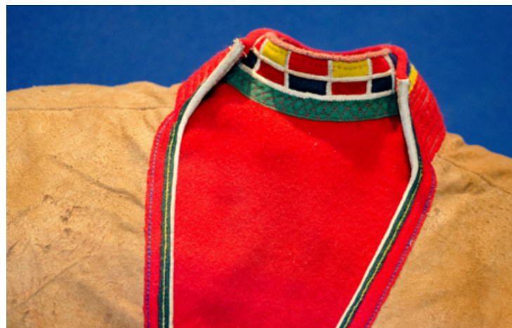
▲ Njalomsliehppá, nissunij. Ruodná mij la tjeibeda vuollegietjen le masjijnajn goarodum. Nordiska Musean.

Muv ráddna máhtsaj sijddaj Stockholmas ja mán de vuolggiv Osloj. Lidjiv juo ávddál gá báhtiv Norsk Folkemuseaj listav sáddim majt sihtiv gæhttjat, ittjiv mán danna besa sijá vuorkájda. Oadtjuv jur gæhttjat dajt duojijt majt lidjiv áhtsám.