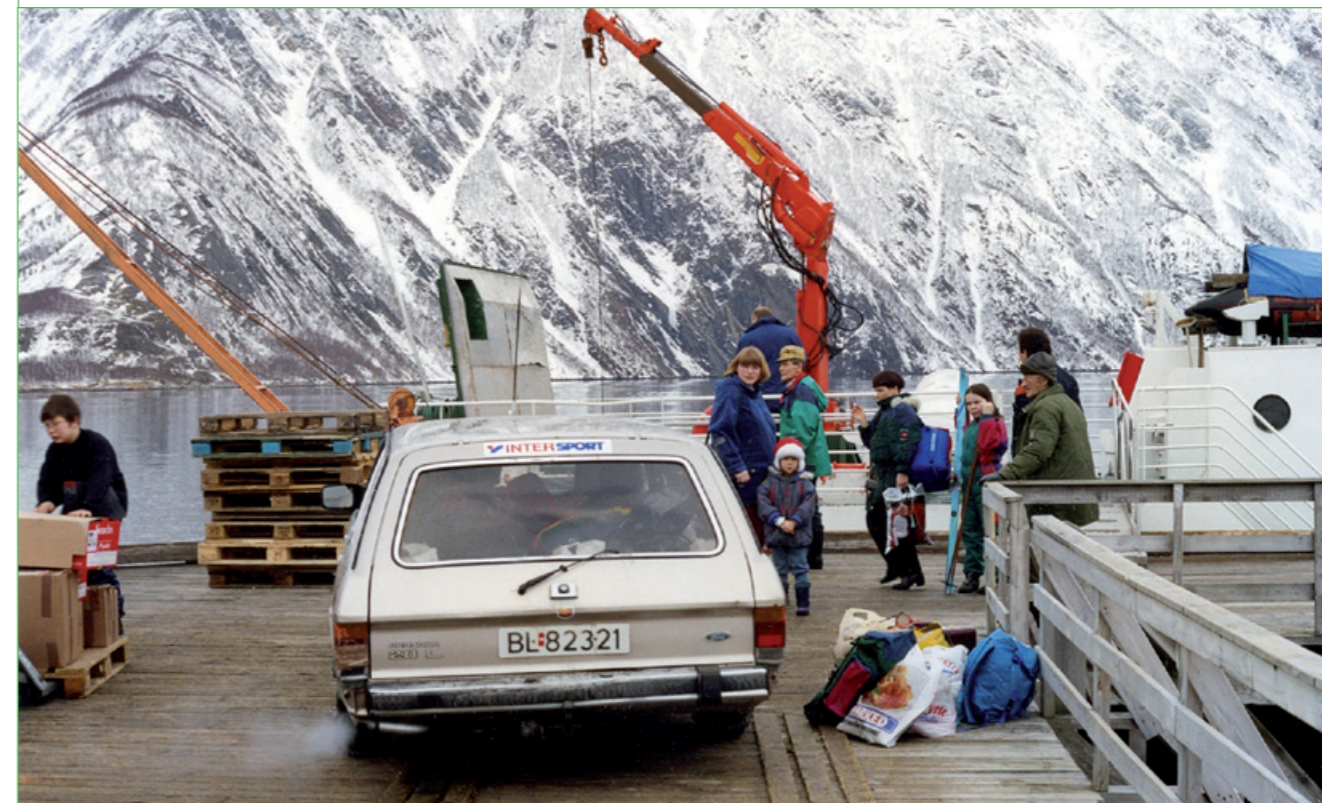
Dát gávva gieses 1992 vuoset ulmutjijt Mäske kájan gudi agev æjvvalin gá jáhtelisvanntsa bádjij.