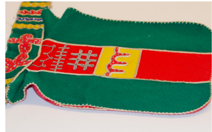
▲ Gehtja dáv sliehpáv!

Munnun lij stuorra friddjavuohta gæhttjat ja gávvit majt sidájma.