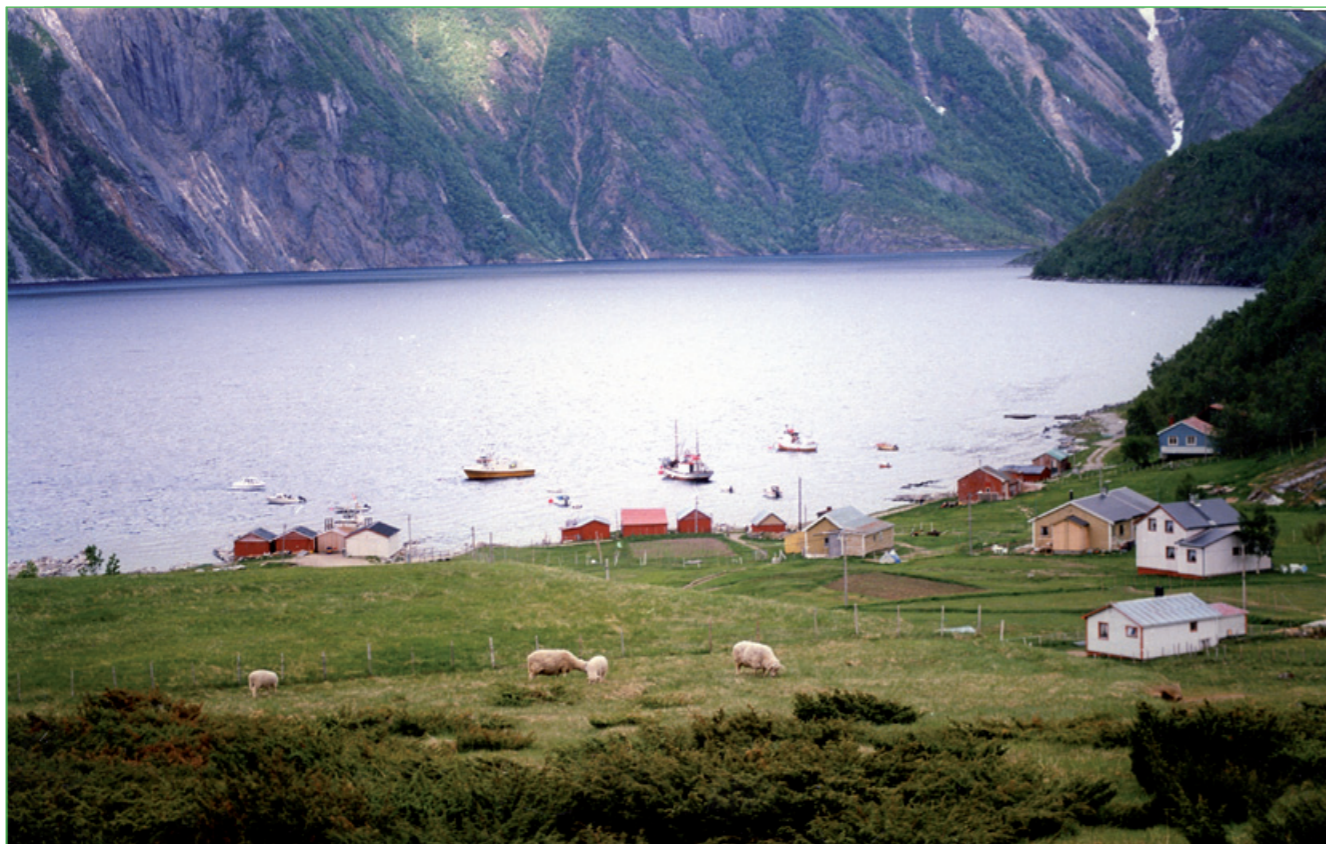
Jagen 1997 lidjin vilá sávtsa Måskén ja guollevantsa gárvvun hámnan.