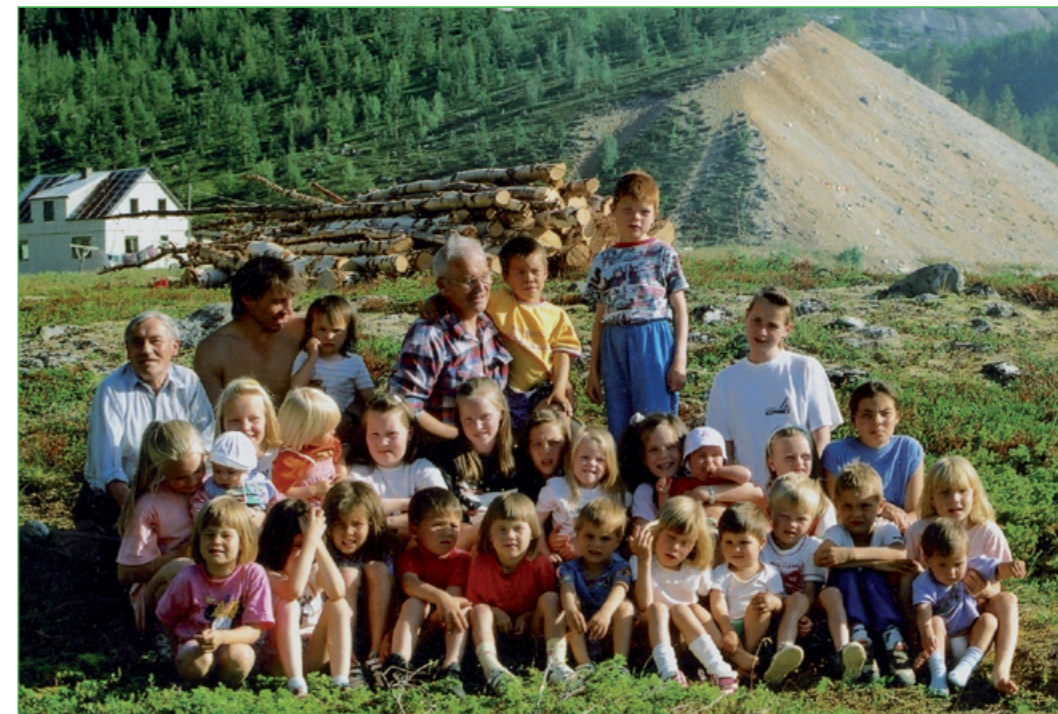
Jagen 1993 lij grunneierlágsmøtta Vuona sinna ja máná tjáhkani gáváv váltatjit.