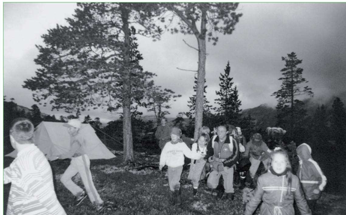
Álgon 1990-lágá lij várreskávllá Biesláphtán Vuodnabadán. Dasi báhtin máná ja nuora áhpatjijt gáktu váren viessot.