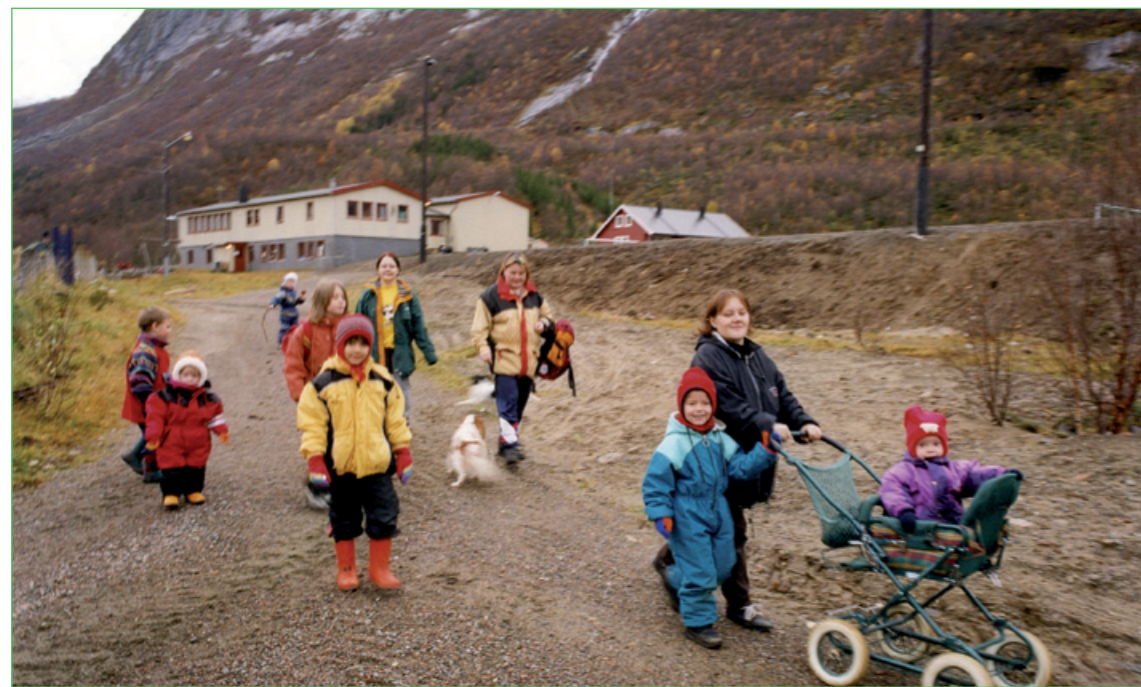
Jagen 1998 Måske mánnágárdde lidjin vádtsemin álggojt.