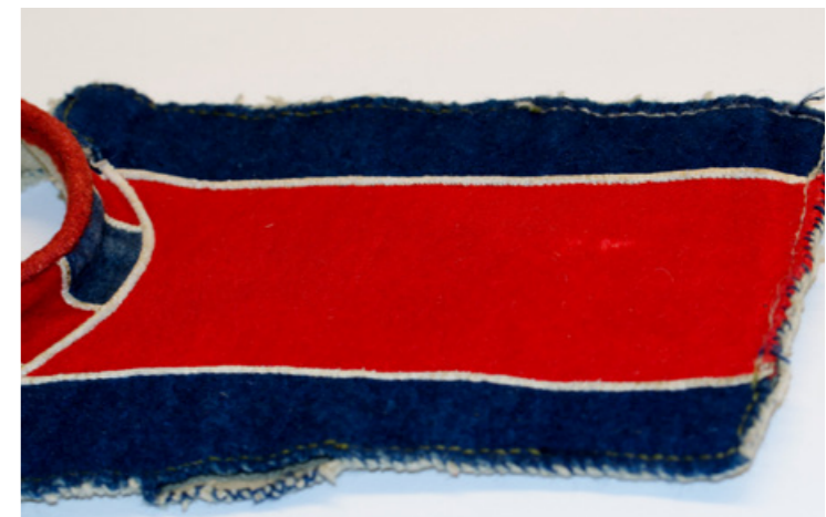
▲ Nissunij sliehppá, gájraksliehppá, sálbbe vuojnu gávva vuollegietjen. Gávvidum Nordiska Musean.