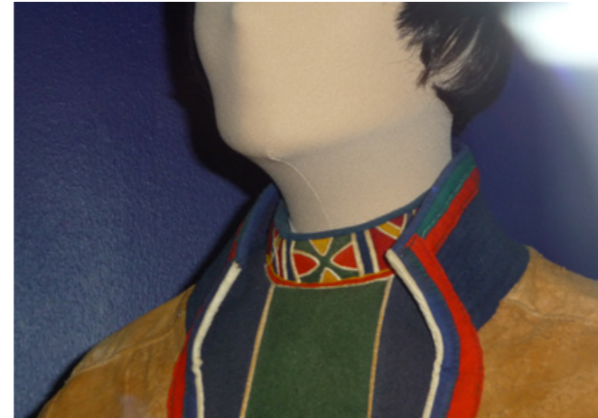
▲ Divtasvuonas gájraksliehppá, álmáj, alek ruvdda badjegietjen ja visská ruvdda gasskaderrásin. Norsk Folkemuseum.