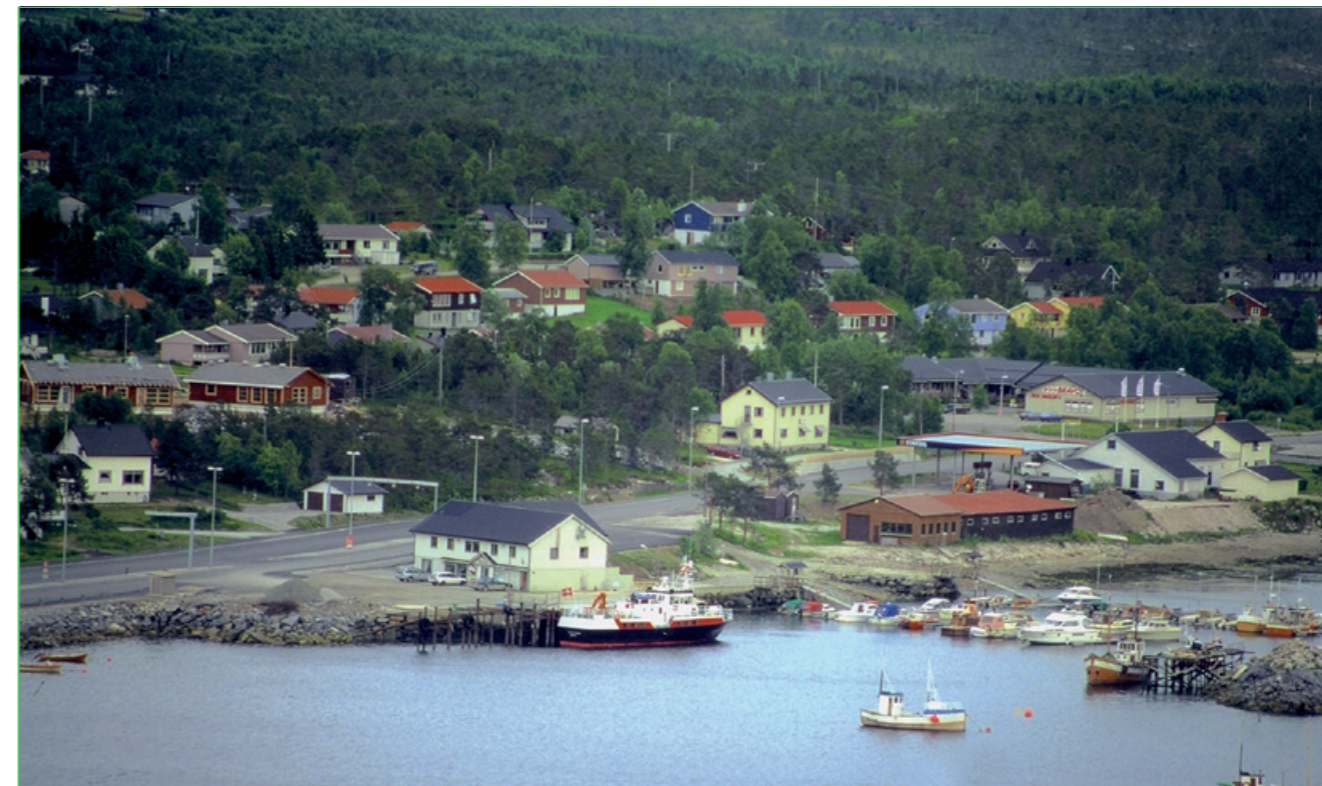
Gávva vuoset gáktu lij Ájluovta hámnan jagen 1995.