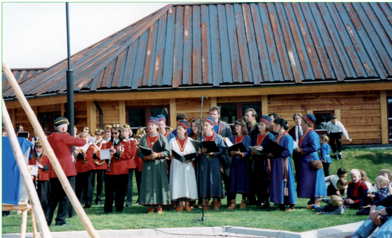
Dán jage le 20 jage dalutjis Árranav ráhpin. Drag skolekorps ja kávrrá lávllun Divtasvuona lávllagav aktan.