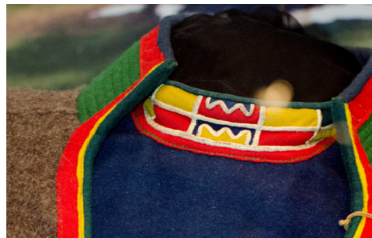
▲ Álmáj njalodum sliehppá. Badjebuttas le ruvdas, ja ruoppsis ruvdda tjeibeda vuollegietjen le masjijnajn goarodum. Nordiska Musean.

◀ Guokta nissunij sliehpá, gáro bielen gájraksliehppá gánná sijdo aj máhtti alega. Rievtes bielen njalomsliehppá máttijn smávva biehkij tjeibedin. Goappátjijn ruvdda badjebuddasin. Gávvidum Nordiska Musean.