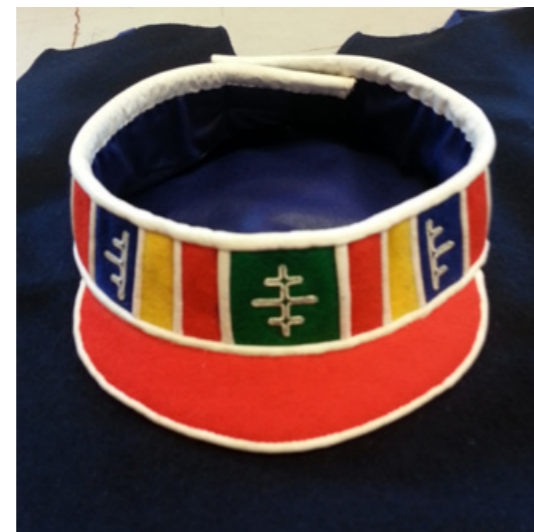
▲ Álmáj sliehpá majt lav mán gárrum, gáro bielen la sliehppá majt badjegietjes sasnev alek ruvdajn málssuv. ■