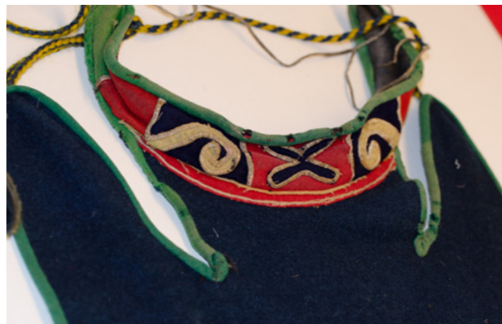
▲ Álmájsliehppá, njallomsليهppá sierralágásj bælljasij. Gávvidum Nordiska Musean.