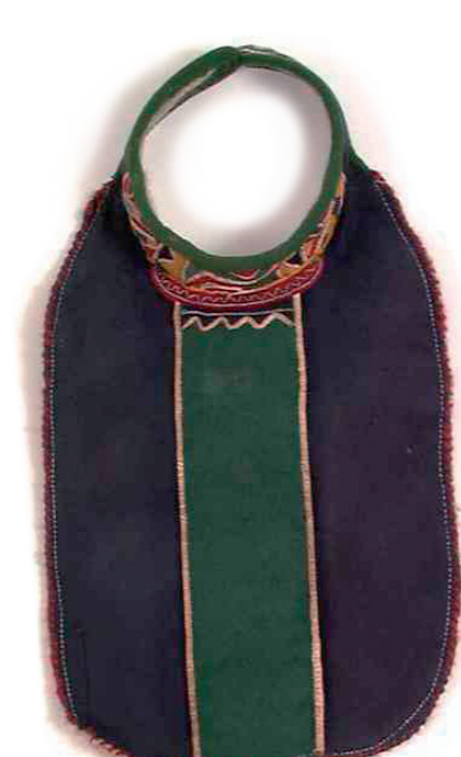
▲ Álmáj gájraksliehppá Divtasvuonas.