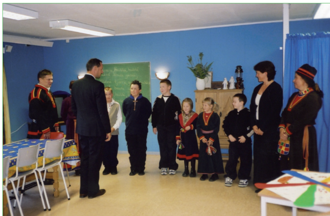
Jagen 2004 lij kronprins Håkon Måskén ja oahppe Måskeskávlán oadtjun iejvvit suv.