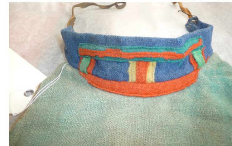
▲ Dát álmájsliehppá le goarodum masjijnajn hullotyddjas, ij la ruvdda ja ij ga bieddjis sassne. Nordiska musean.

www.digitaltmuseum.no ▶ søk brystklede www.digitaltmuseum.se ▶ søk barmkläd