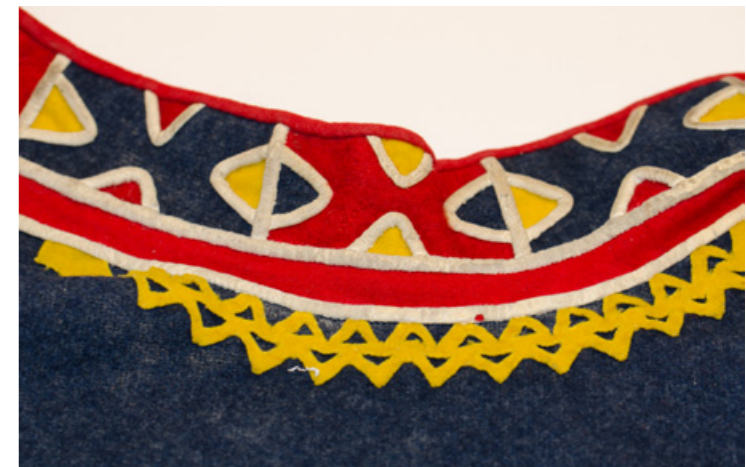
▲ Ja dáv! Nordiska Musean.