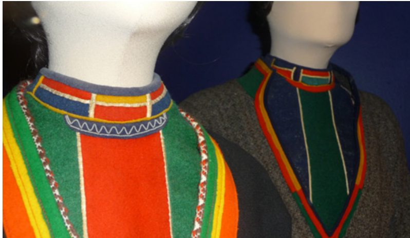
▲ Gåvå Norsk Folkemusean. Sliehpá Divtasvuonas , nissunij sliehppá gáro bielen, ja álmáj rievtes bielen. Badjebuttas alek ja gasskaderas visská ruvdas. Ja badjebuttas gápten juohkirik oassto bádde.