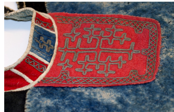
▲ Álmájsliehppá, daddnesliehppá, gávvidum Nordiska Musean.