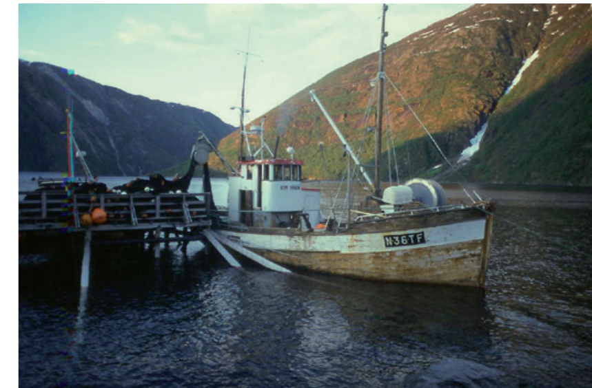
Måske kádja. Gidá. Sájdde badjánam Tjájne gaskan. Sájdenuohtev giessi vanntsaj.

Vuollen fiervvágáttij juo lij de bievlá. Várijt lij ánj muohta, valla viehka suddam. Javrijn lij ánj jiegná mij ulmutjav guottij. Jávrin lij rávddo majt bivddin vuokkajn, sliddjavuokkajn mij vuojoj. Tjuovkábadnen gánná guolle vuojnuj. Oaggot gánná jienan rájgge, hillagábme. Gánná ællim rájge, de dajda guoddin giergij majt biejuvve lieggij. Gierge de dahkin rájgij ietjá bæjvváj gá vat báhtin ákkutjit.