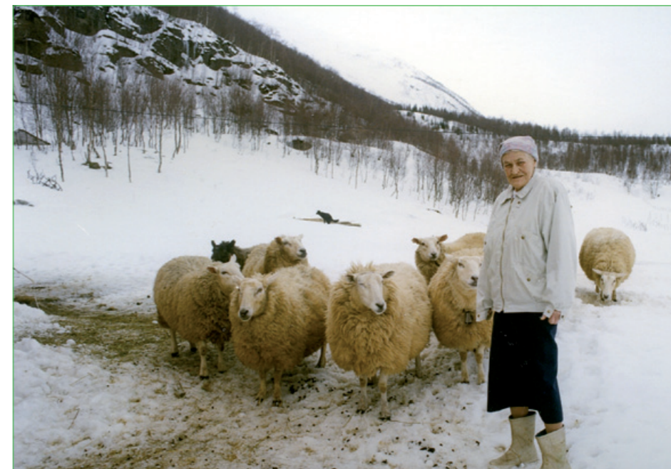
Måske Ristinav vuojnnepet ietjas sávtsaj jagen 1997.