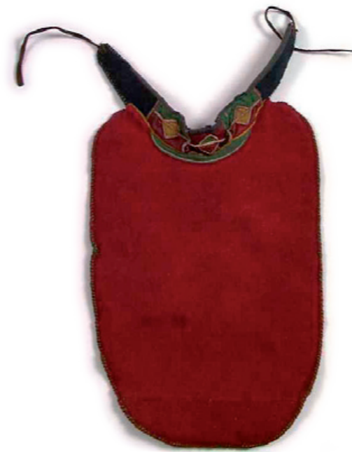
▲ Nissunsliehppá Divtasvuonas, Norsk Folkemuseum.