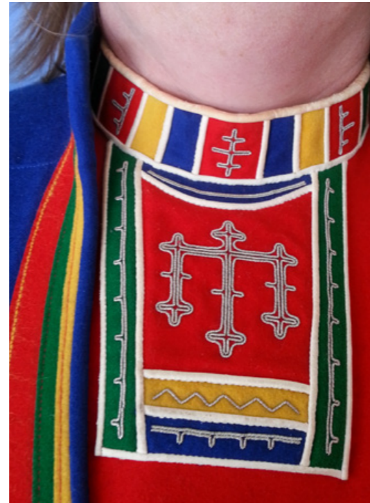
▲ Ádáájjgásasj nissunij daddnesliehppá majt lav mán gárrum. Gáro bielen le vuollegietje járbbidum, ja nuppen tjiegak.