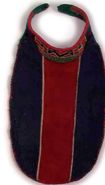
▲ Nissunij sliehppá Sørfoldás, Norsk Folkemuseum.